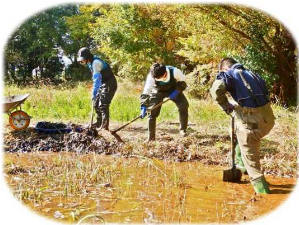
11月15日、自然環境復元協会レンジャーズと作業