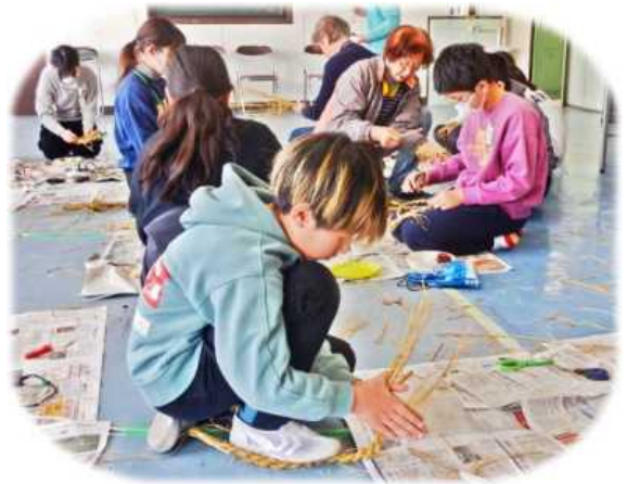
1月21日、新浜小学校で「わらないリース」