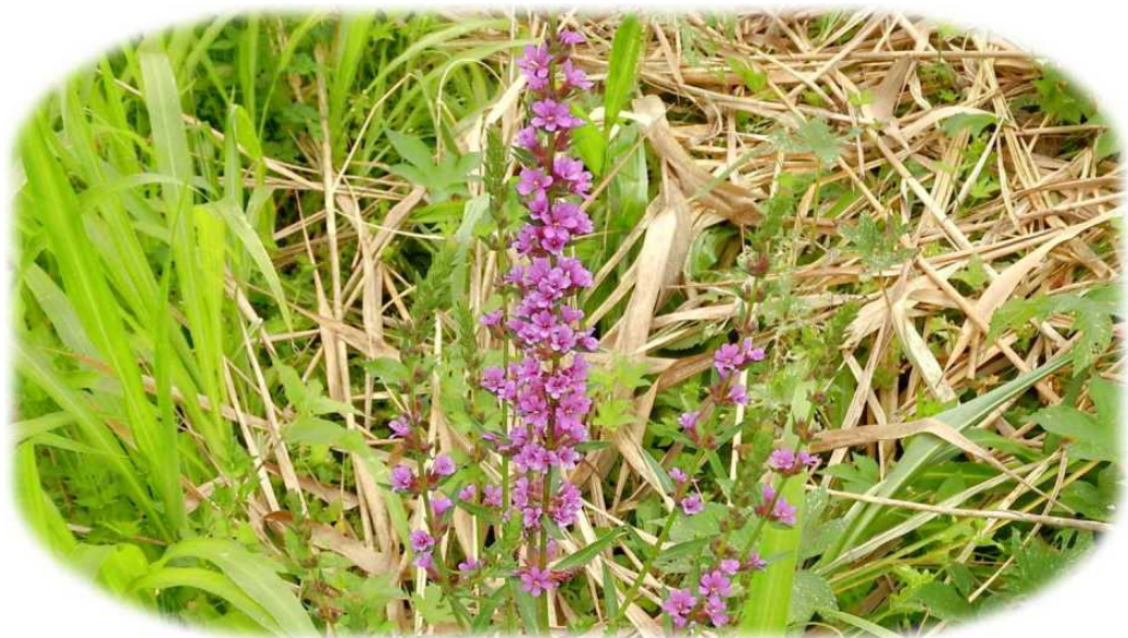
ミソハギ、北方ミニ自然園にて2025年7月撮影。

事務局 住所：272-0816 市川市本北方3-19-2 大場方 電話090-4844-2358 FAX047-338-8879