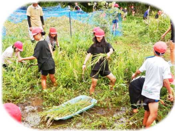
9月19日、若宮小学校の稲刈り