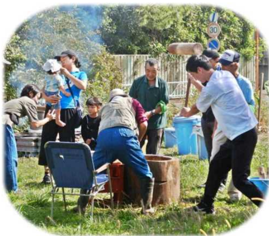
10月18日みどりの寺子屋 「収穫祭」