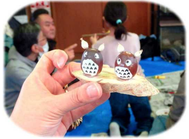
11月9日、北方遊水池のふしぎ大発見6