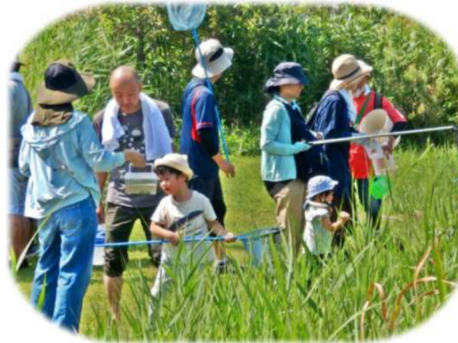
8月24日緑の楽交 「夏の水辺の自然観察」